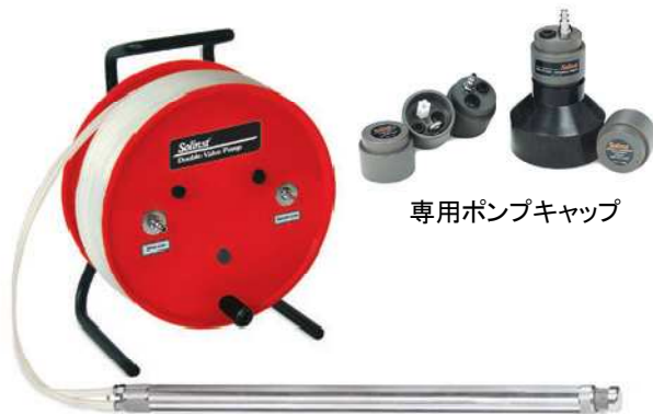
ポータブルポンプ、ハンドリール

モデル408ダブルバルブポンプ(DVP)は高い品質を実証されたドライブポンプで、最高のパフォーマンスと信頼性を提供します。ポンプの構造はシンプルで、ブラダ一等の交換が不要です。DVPは通常のサンプリングの他に、ローフローサンプリングにも適していて、用途に合わせて材質とサイズが選択可能です。ステンレス製ポンプは最大揚程150m、PVC製ポンプは最大揚程30mです。ポンプの外径は16mmと42mmの2種類から選択することが可能で、1インチの井戸(26.1mm)からも揚水することが可能です。