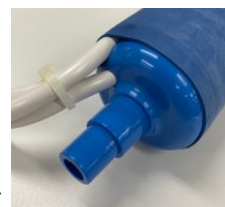
チューブ取り付け部分