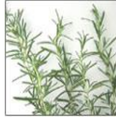
マンネンロウ (英名：ローズマリー)